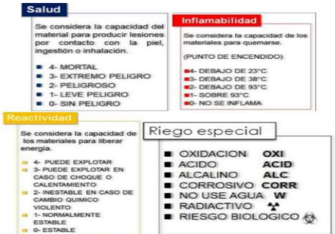
FIGURA 3. CONSIDERACIONES GENERALES POR SECCIÓN DE RIESGO

Cabe señalar que por las características de la obra no se generarán residuos peligrosos. Sin embargo, se considerará las siguientes medidas de prevención en el manejo de residuos peligrosos, para evitar algún accidente laboral o algún impacto al medio ambiente.