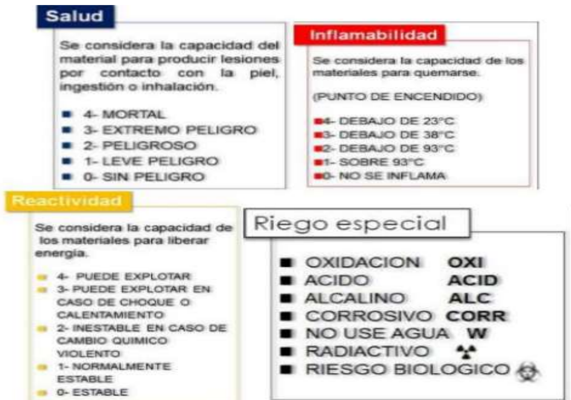
FIGURA 3. CONSIDERACIONES GENERALES POR SECCIÓN DE RIESGO

Cabe señalar que por las características de la obra no se generarán residuos peligrosos. Sin embargo, se considerará las siguientes medidas de prevención en el manejo de residuos peligrosos, para evitar algún accidente laboral o algún impacto al medio ambiente.