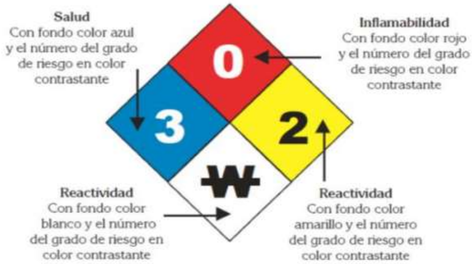
FIGURA 1 ROMBO DE