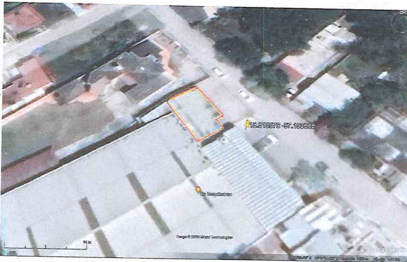
Figura 1. Predio donde se pretende realizar EL PROYECTO, se resalta en rojo la delimitación de los vértices del predio.

Al respecto, se realizó la corroboración de la delimitación del predio dadas las coordenadas geográficas proporcionadas con ayuda de Google Earth Pro (versión 7.3.2.5491, 32 bit para Microsoft Windows, Image 2022 Maxar Technologies, licencia Freeware) como herramienta virtual de visualización cartográfica basada en fotografía satelital (Fig 1).