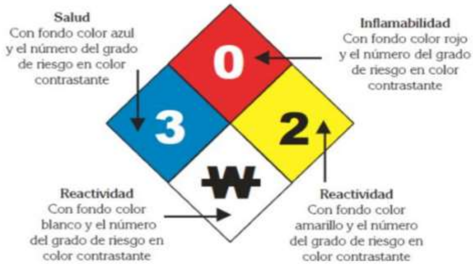
FIGURA 1 ROMBO DE