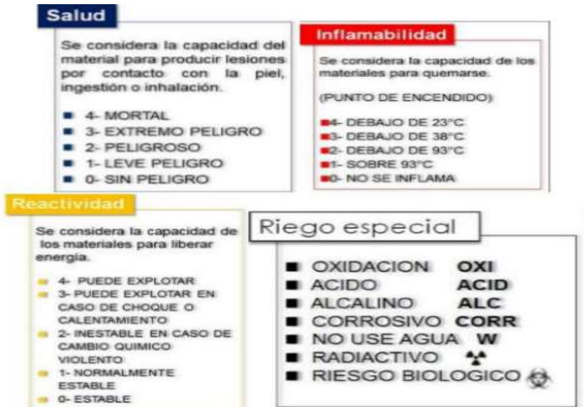
FIGURA 3. CONSIDERACIONES GENERALES POR SECCIÓN DE RIESGO

Cabe señalar que por las características de la obra no se generarán residuos peligrosos. Sin embargo, se considerará las siguientes medidas de prevención en el manejo de residuos peligrosos, para evitar algún accidente laboral o algún impacto al medio ambiente.